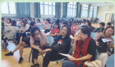
「正向管教－培養子女的性格強項」