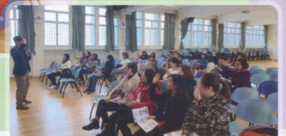
「運用正念思考管理情緒」