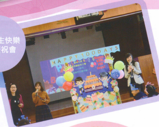
小一新生快樂百日慶祝會

家教會委員和一群熱心家長義工對學校的支持和信任，這是學校前進的動力，也是使我感動的地方。學校老師會繼續用心教學和籌辦學習活動，與家長攜手締造更理想的學習環境。