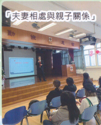
「夫妻相處與親子關係」