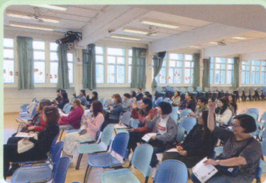
「三個正向方法增強孩子解難力」