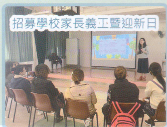
招募學校家長義工暨迎新日