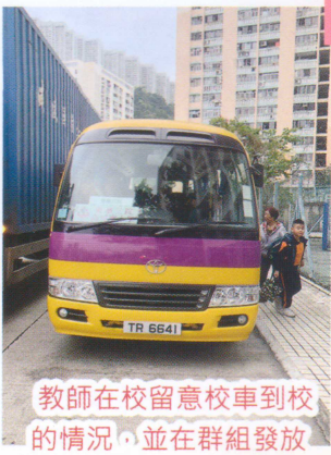
教師在校留意校車到校的情況，並在群組發放