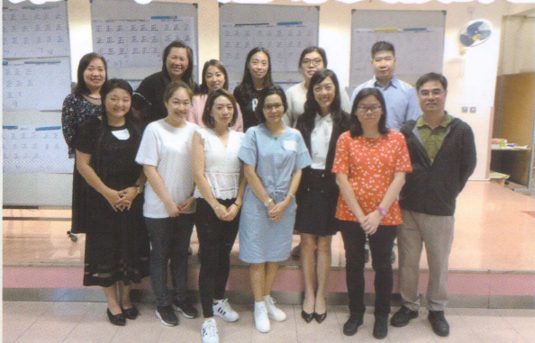
10月21日點票大會，感激家長出席支持！

我們的重頭戲「家教會會員大會」每年都在學年初進行，本年度有12位家長參選本屆常任委員，當中更有一年級的家長參與，家長的積極參選，為我們帶來動力。同事們都努力籌備會員大會，期望選出新一屆的委員，展開美好的開始。可惜事與願違，原訂於10月5日舉行的第二十二屆家長教師會常任委員選舉因交通情況取消，未能選出委員，令家教會所有事務都停下來。這時，大家都感到十分徬徨，幸好最終找到解決方法，以通告形式派發選票，起初都擔心收回的選票不足，但家長們都十分支持「非一般的選舉」，收回的選票數量超過85%，實在令人感動。今年又有幾位新的成員加入家教會，跟我和舊委員一起合作，繼續為學校服務，真是萬分感激！