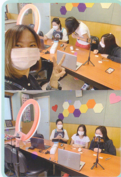
「潘姑娘禪繞教室」拍攝花絮